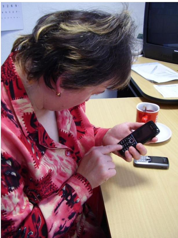
Nácvik práce s pomůckou