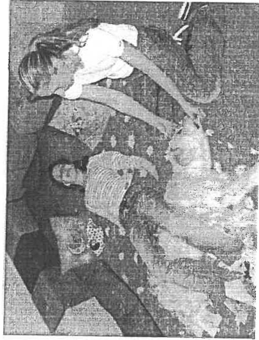
Tak vypadá canisterapie v praxi.

Určitou formou sponzoringu ze strany nemocnice jsou minimální poplatky za pronájem ordinace. Ty by se do budoucna podle ředitele neměly zvyšovat. „Vždyť jde převážně o postižené děti,“ uzavřel Lečbých.