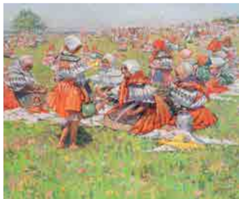
Joža Uprka, Pout' u sv. Antonínka , 1924, 88 x 142 cm, olej, plátno, Galerie Joži Uprky

do 11. 9. – 1. podlaží budovy 14 Komentovaná prohlídka 16. 8. v 17.00 hod.