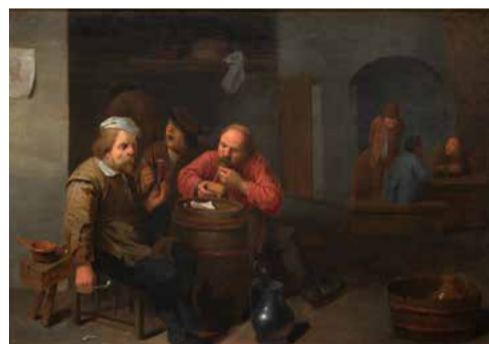
David Rijckaert (III), Kuřáci v hostinci, 1640 - 1650, olej na dřevěné desce, 39 x 55cm, Alšova jihočeská galerie

Komentovaná prohlídka s kurátorem výstavy 16. 6. v 17.00 hod.