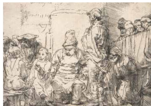
Rembrandt, Ježíš diskutuje v chrámě, 1654, lept, papír, NPÚ, ÚPS v Kroměříži, SZ Buchovice (výřez)

do 5. 7. - 2. podlaží budovy 14, grafický kabinet